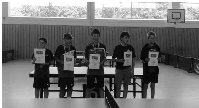
Sieger der KRL U15