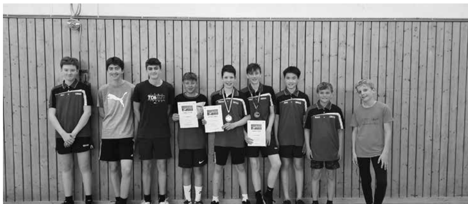
Teilnehmer der KRL U19 und U13