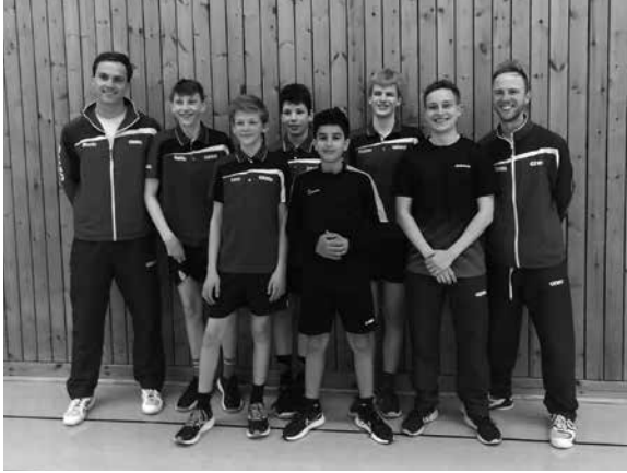
Spieler und Trainer bei der LMM U15

Am Samstag, dem 06. Mai war es nun endlich so weit. Die U15.1 macht sich im Morgengrauen auf die Reise nach