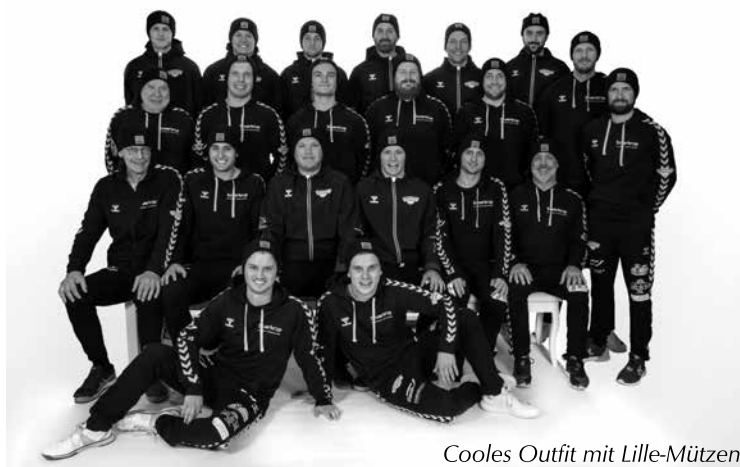
Cooler Outfit mit Lille-Mützen