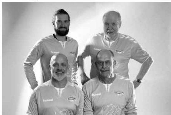
Das Team um das Team

Aktuelle Infos findet ihr wie immer un- ter www.crowntown.de , Facebook, In- stagram und im nächsten Sportspiegel.