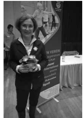
Goldene Ehrennadel 50 Jahre Mitgliedschaft