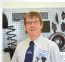
E. Langus Service