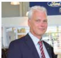
B. Klöforn Verkauf

Herzlich willkommen • Ihr Verkauf-Service-Team