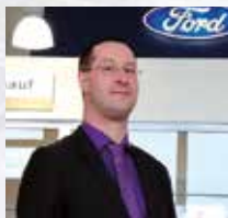
C. Ehlers Verkauf