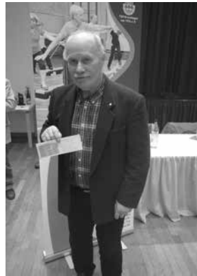
Goldene Ehrennadel 60 Jahre Mitgliedschaft