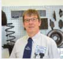
E. Langus Service