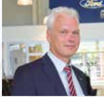
B. Klöforn Verkauf

Herzlich willkommen • Ihr Verkauf-Service-Team