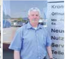
E. Jäger Service