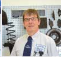
E. Langus Service