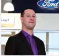
C. Ehlers Verkauf